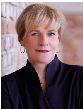
Simone Oldenburg Ministerin für Bildung und Kindertagesförderung