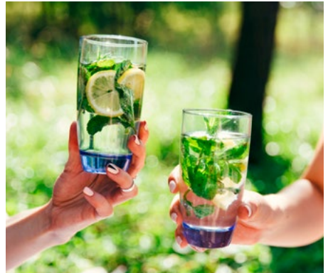
Wasser schmeckt auch mit unbehandelter Zitrone und Minze.