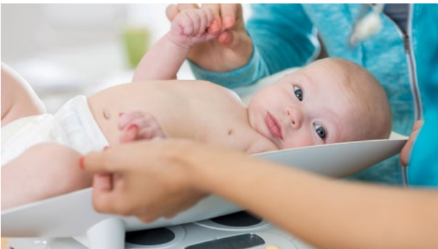
Säuglinge werden von Hebammen oder in der Arztpraxis regelmäßig gewogen.

Einen BMI-Rechner finden Sie auf der Internetseite www.uebergewicht-vorbeugen.de . Dort erhalten Sie eine individuelle Antwort zum errechneten BMI.